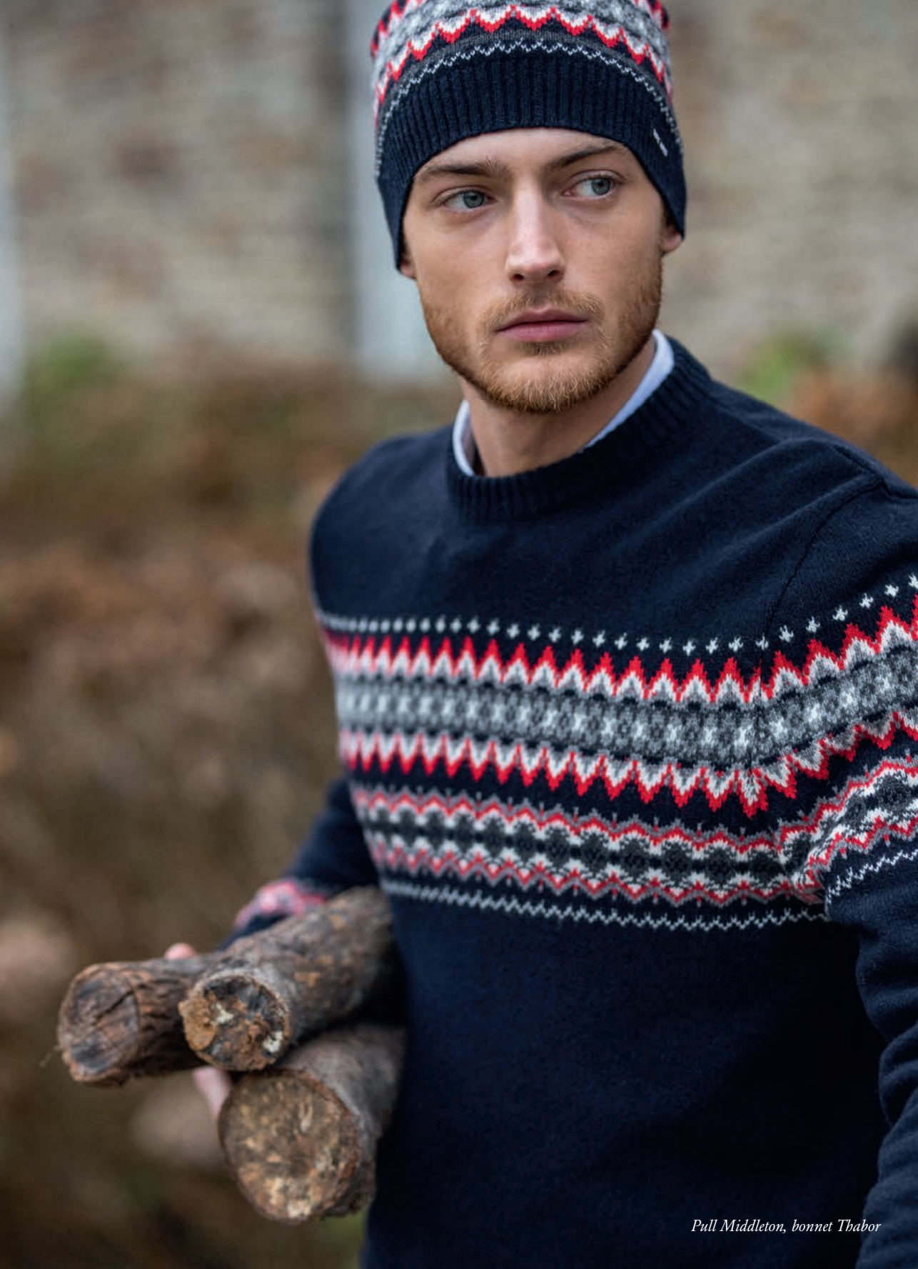
Pull Middleton, bonnet Thabor