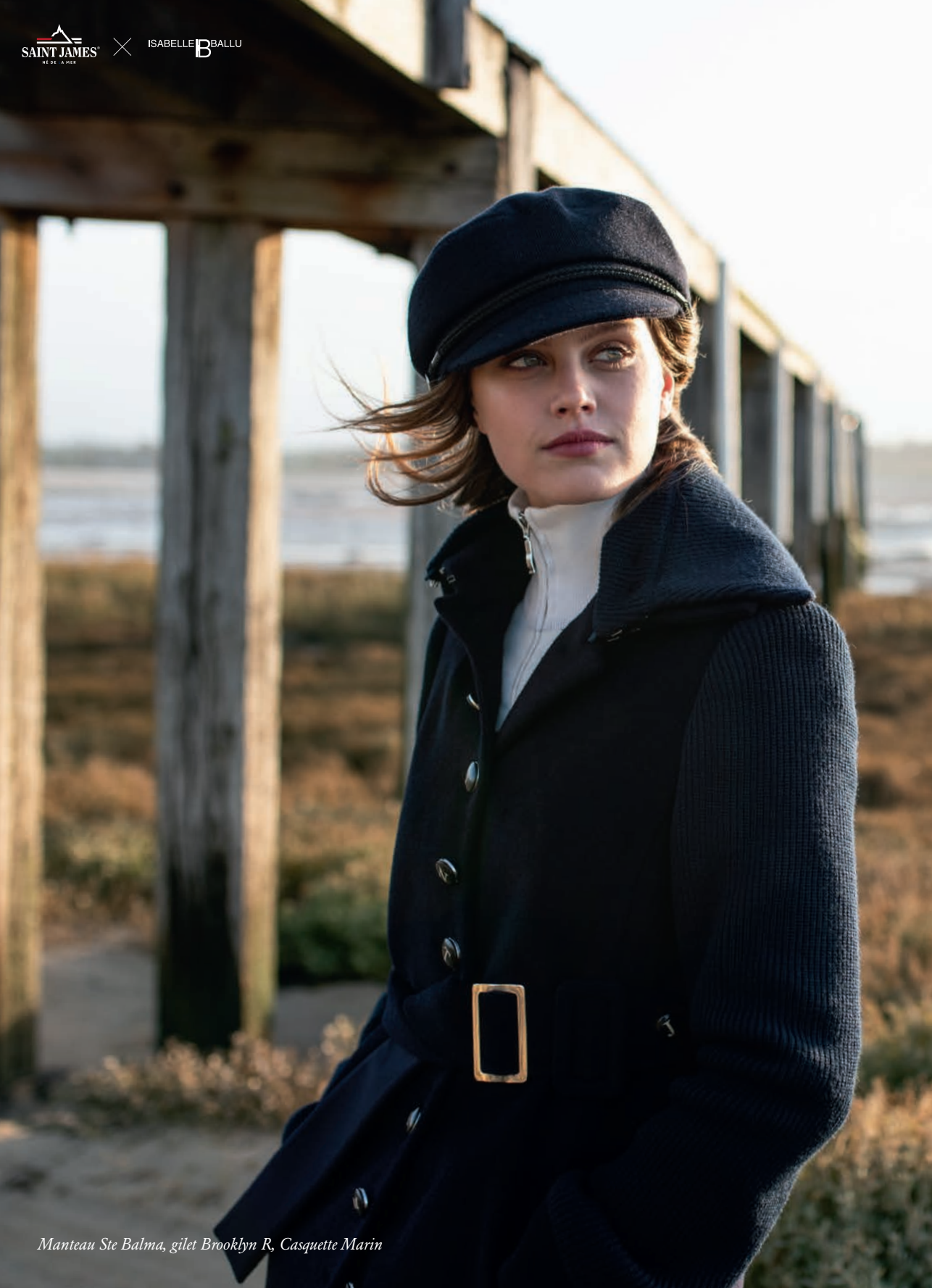
Manteau Ste Balma, gilet Brooklyn R, Casquette Marin