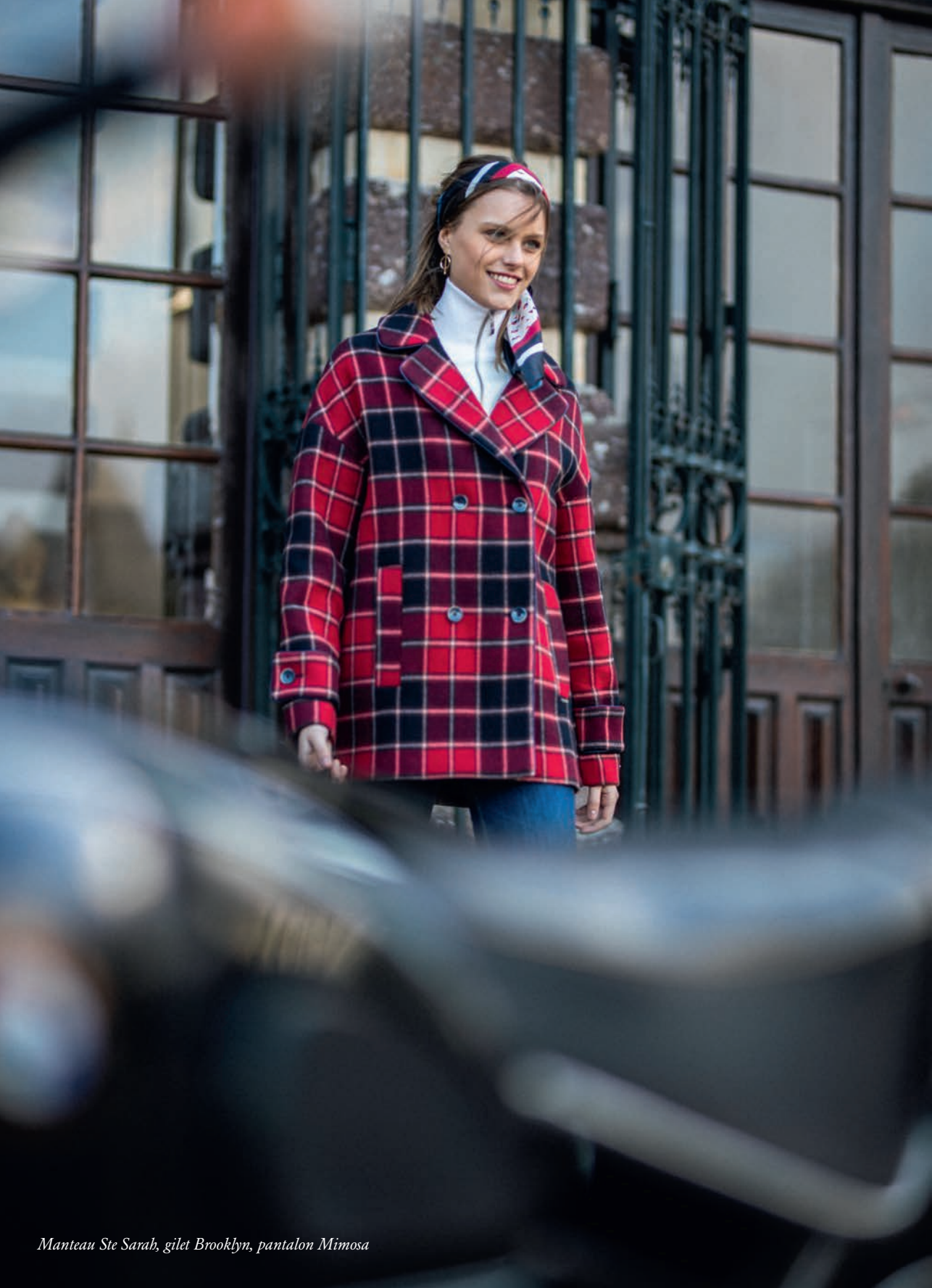
Manteau Ste Sarah, gilet Brooklyn, pantalon Mimosa