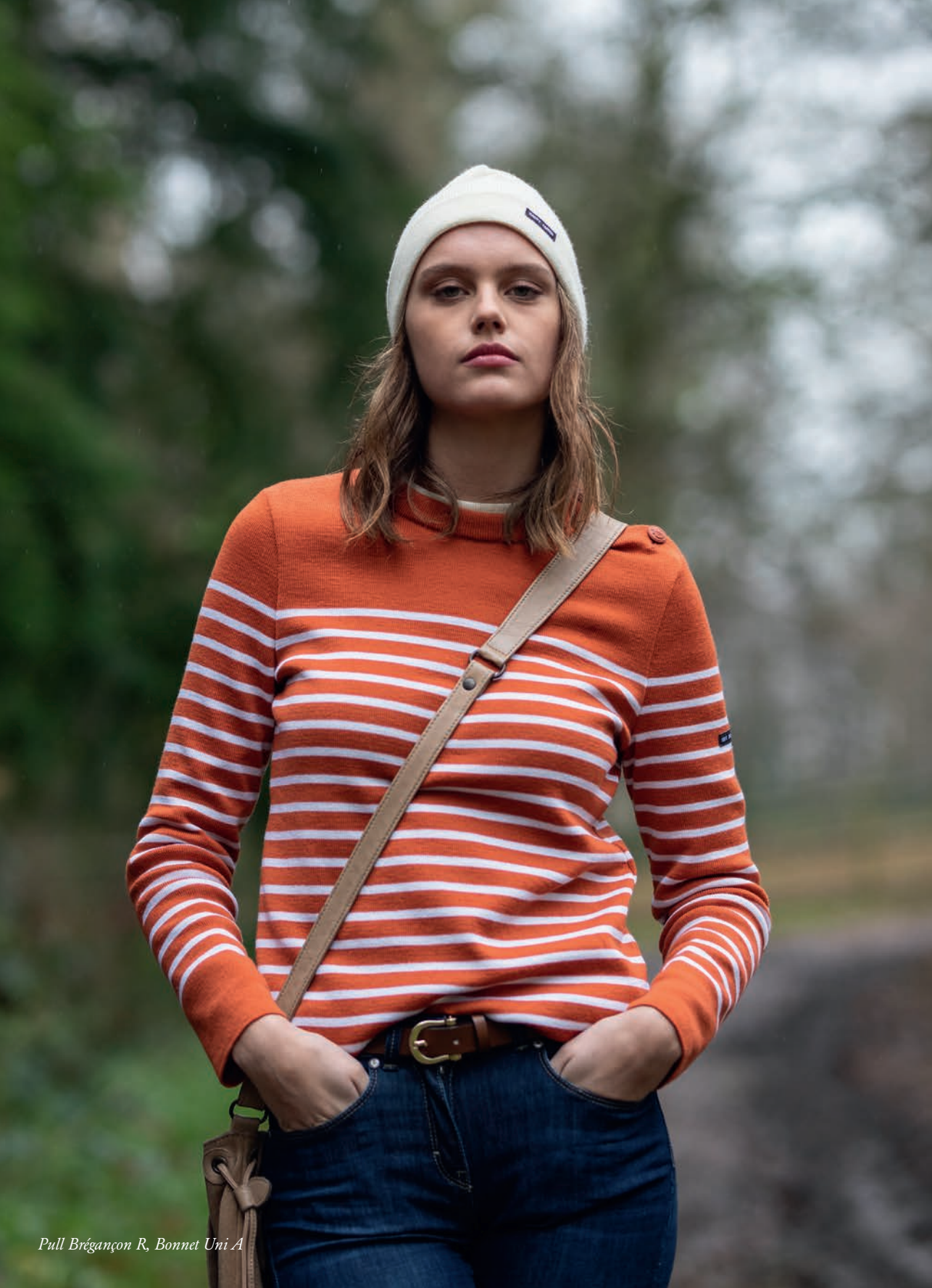
Pull Brégançon R, Bonnet Uni A