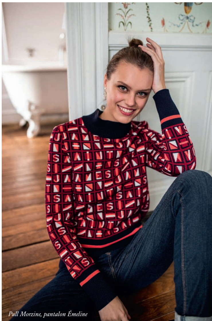
Pull Morzine, pantalon Émeline

S ous le manteau en drap de laine, couleur cherry, sublimé par une fausse fourrure blanc d'hiver, le pull graphique en quatre couleurs, une maille à la tenue parfaite, le goût du détail couleur corail, et la vie n'est plus que fantaisie. Dedans, dehors, SAINT JAMES, on adore !