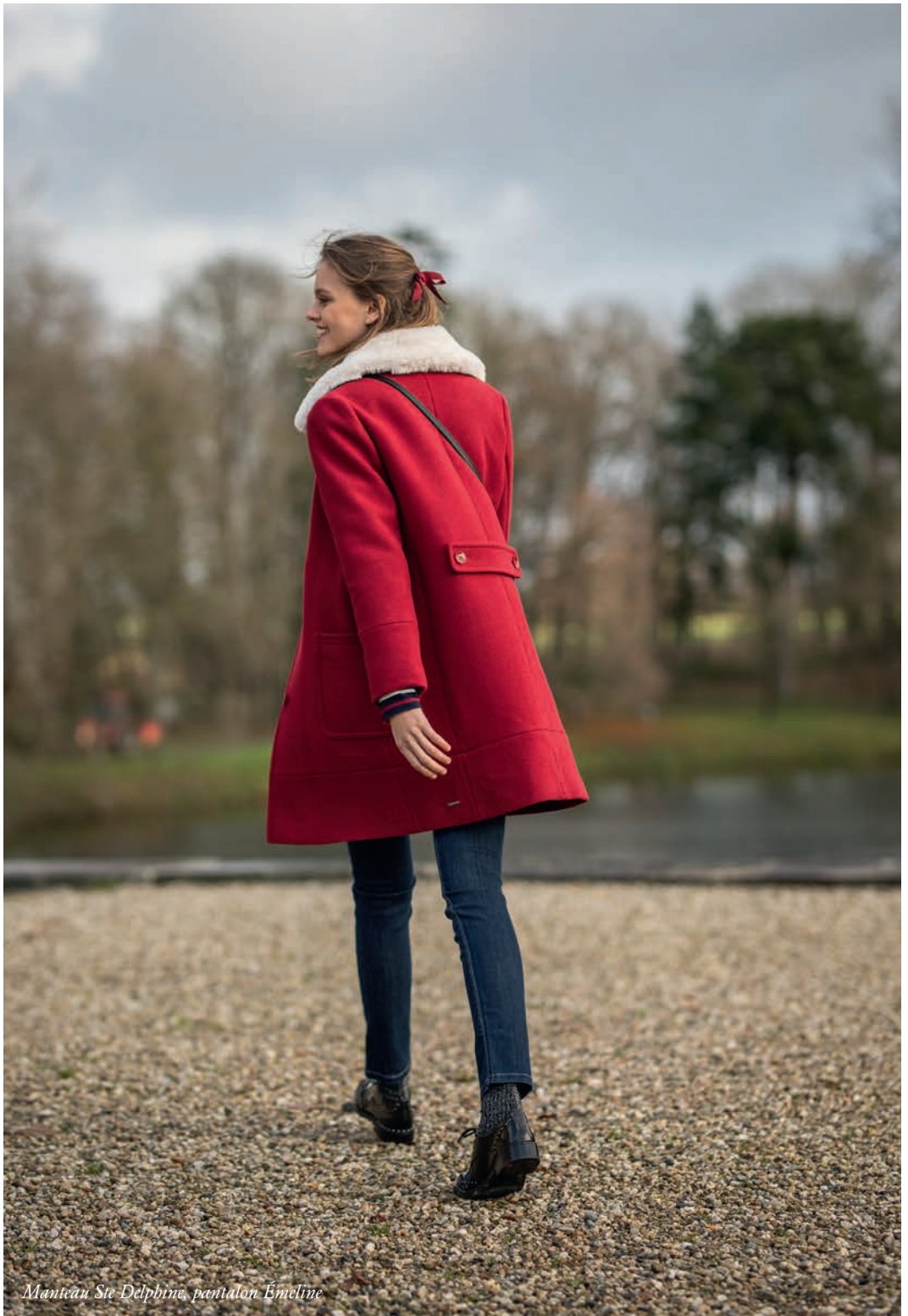
Manteau Ste-Delphine, pantalon Émiline