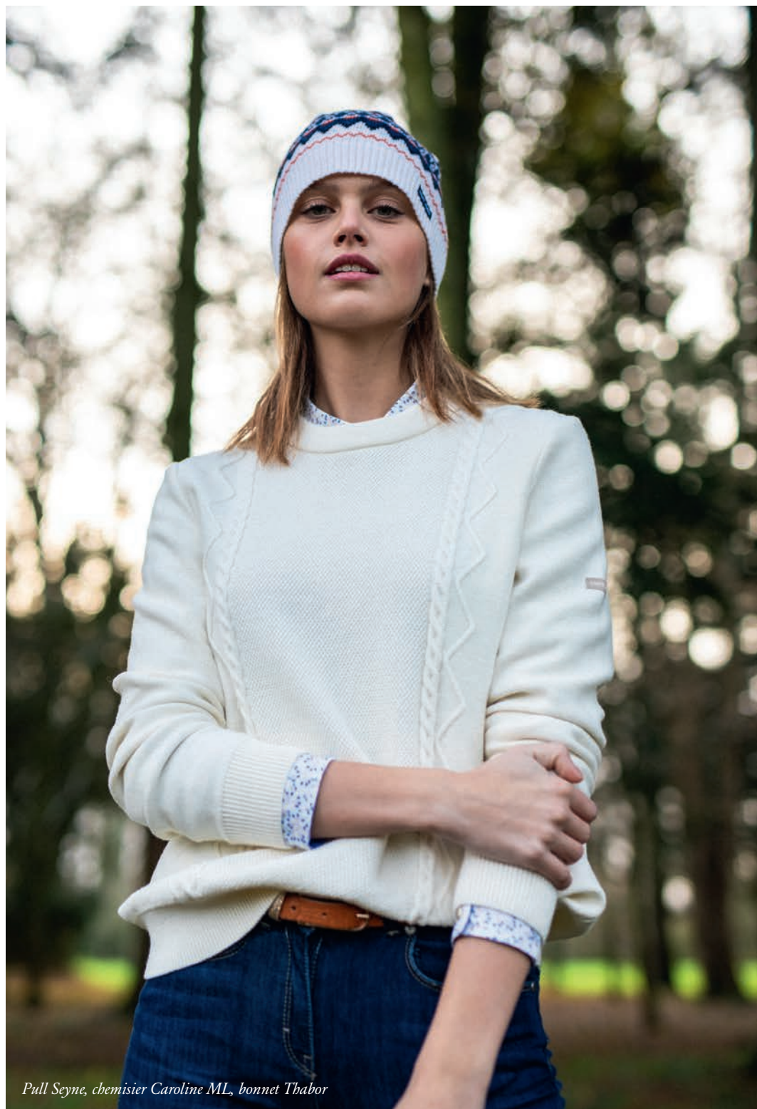
Pull Seyne, chemisier Caroline ML, bonnet Thabor