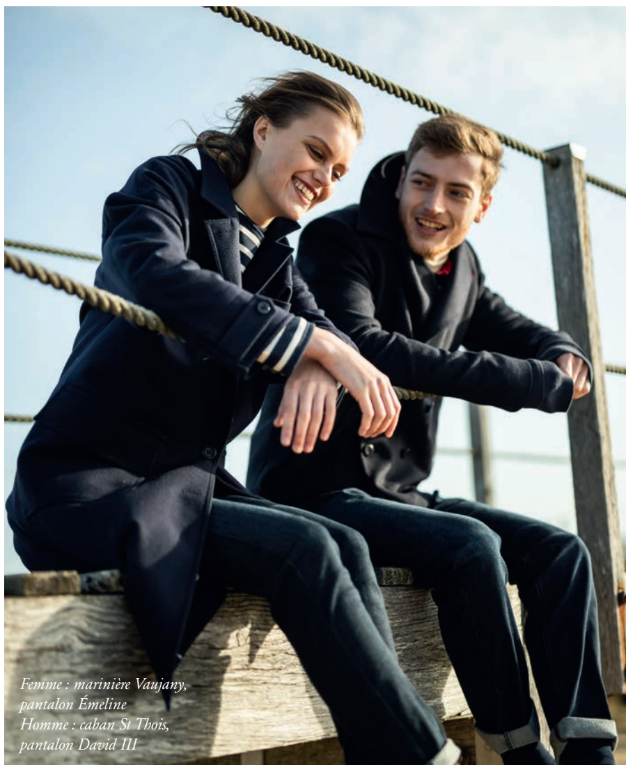
Femme : marinière Vaujany, pantalón Émeline Homme : caban St Thoïs, pantalón David III

F éminins, masculins ou mixtes, en SAINT JAMES, les styles s'affirment et revendiquent l'esprit de liberté. Des vêtements dans l'air du temps qui laisseront sur les photos des souvenirs intemporels.