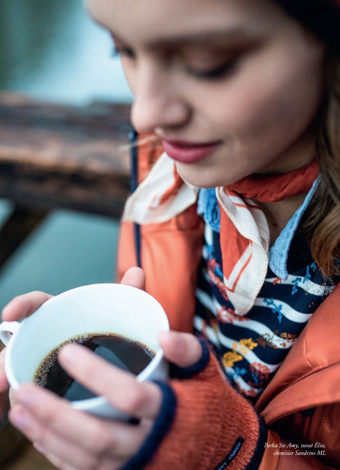
Parka Ste Amy, sweat Élise, chemisier Sandrine ML