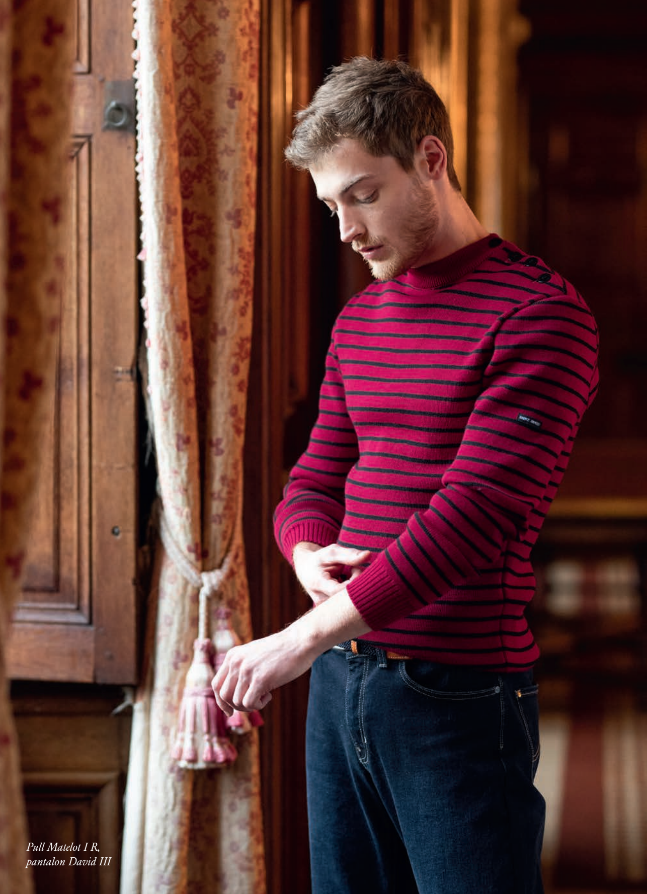
Pull Matelot I R, pantalon David III