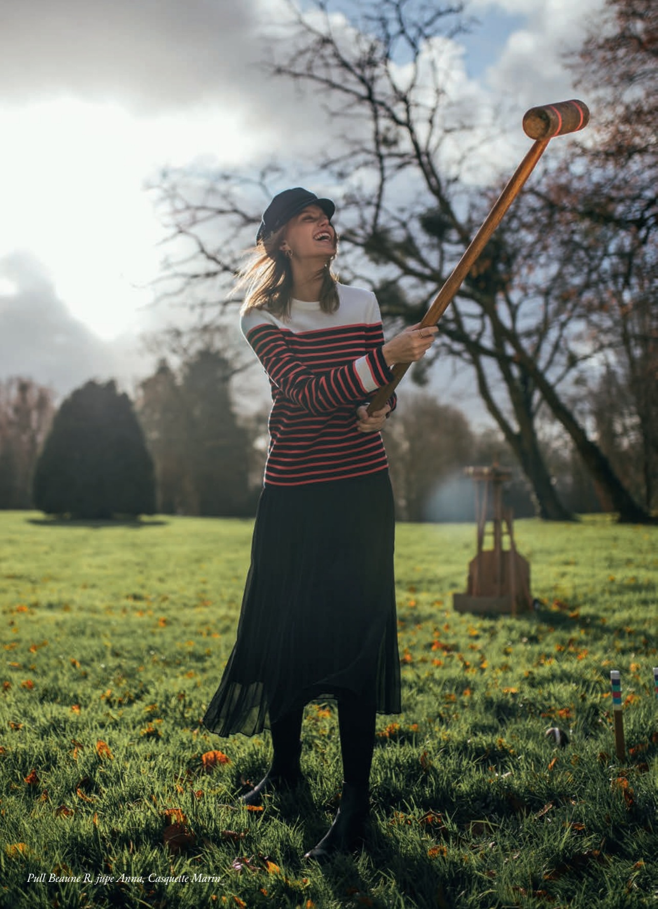
Pull Beaune R, jupe Anna, Casquette Marin