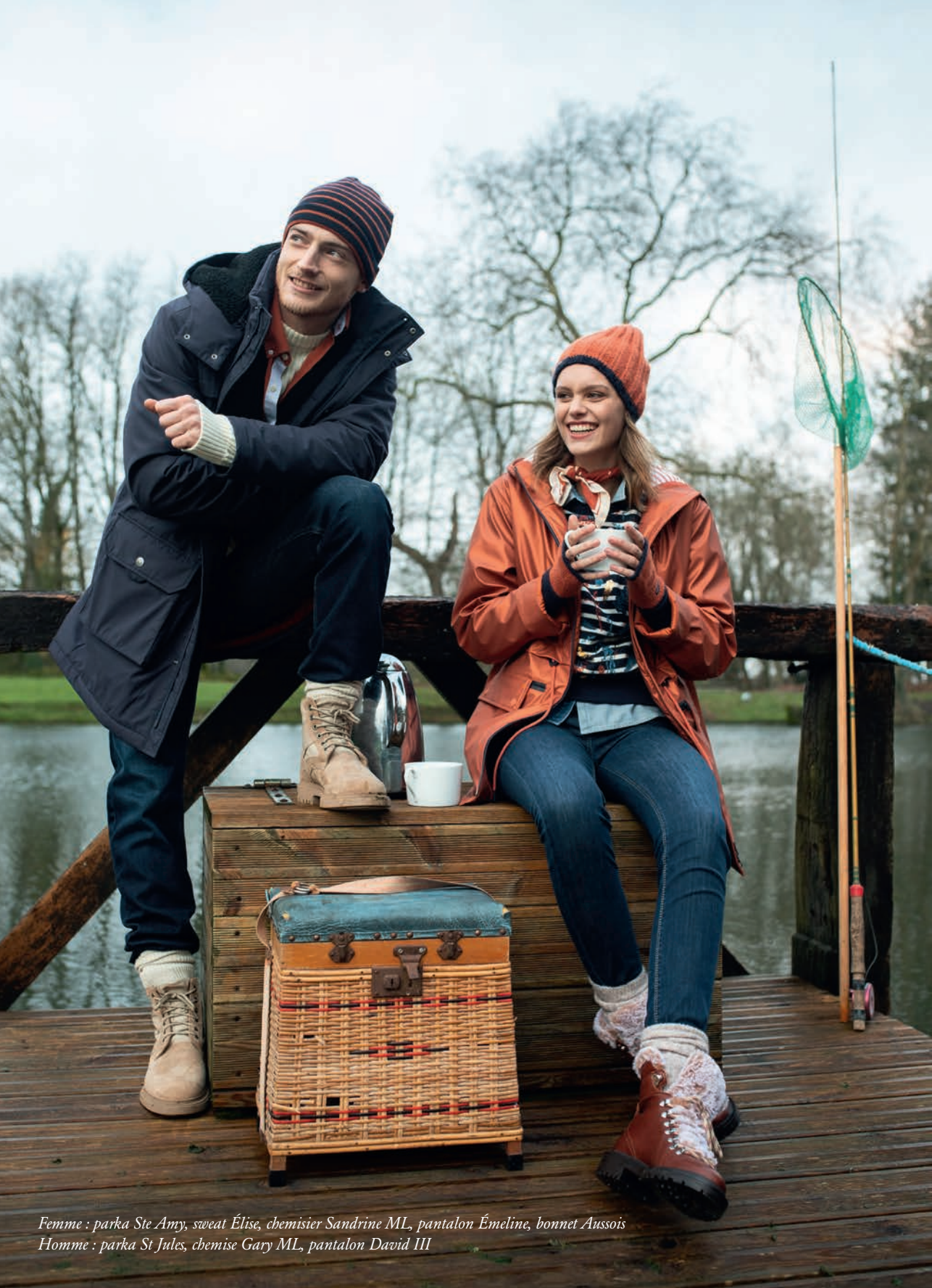
Femme : parka Ste Amy, sweat Élise, chemisier Sandrine ML, pantalon Émeline, bonnet Aussois Homme : parka St Jules, chemise Gary ML, pantalon David III