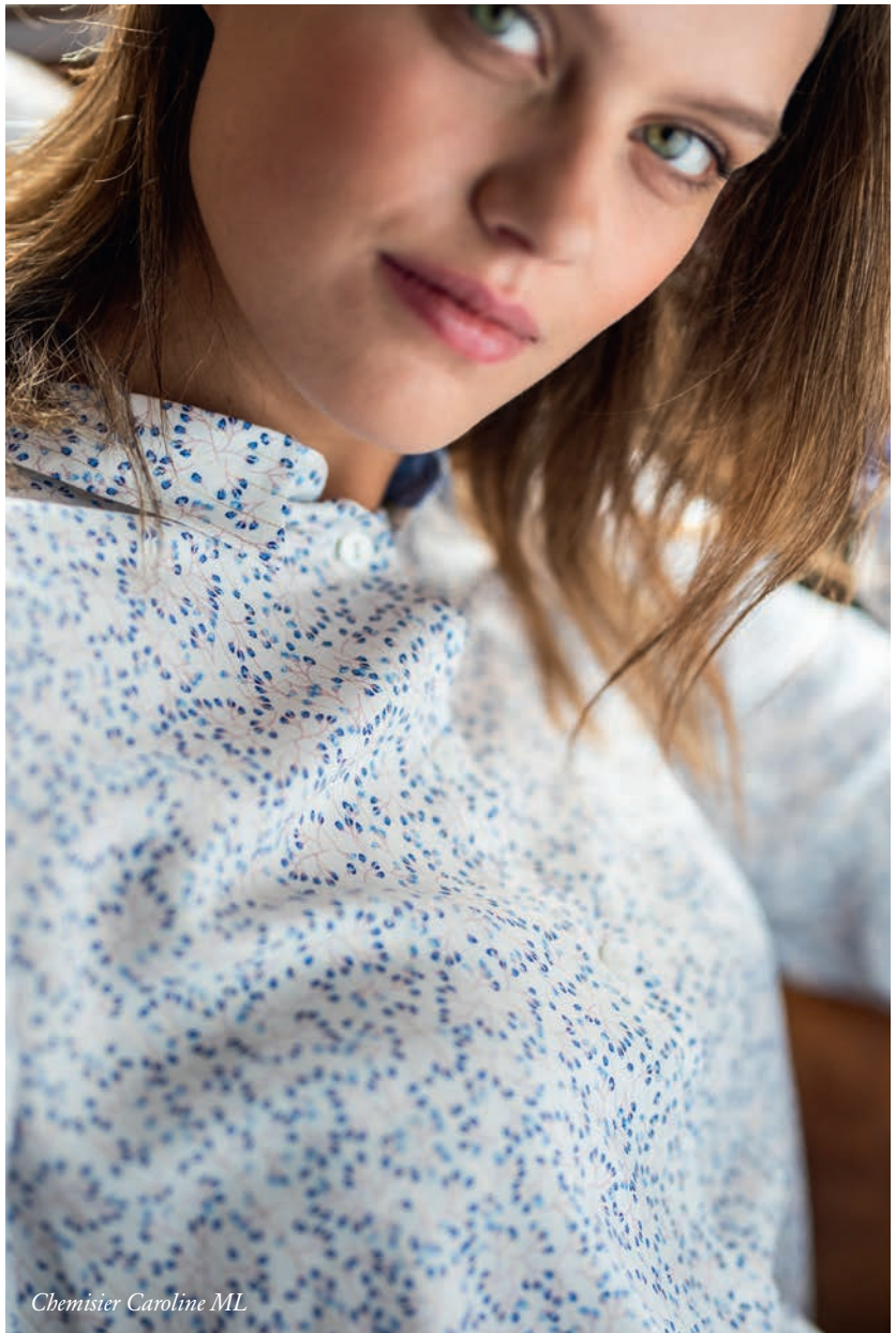
Chemisier Caroline ML

A chaque moment, le bon vêtement. En monogramme pour étudier, en pull torsadé rouille et blanc d'hiver, confortable à souhait, pour rêvasser, en chemisier délicat et léger pour la soirée.