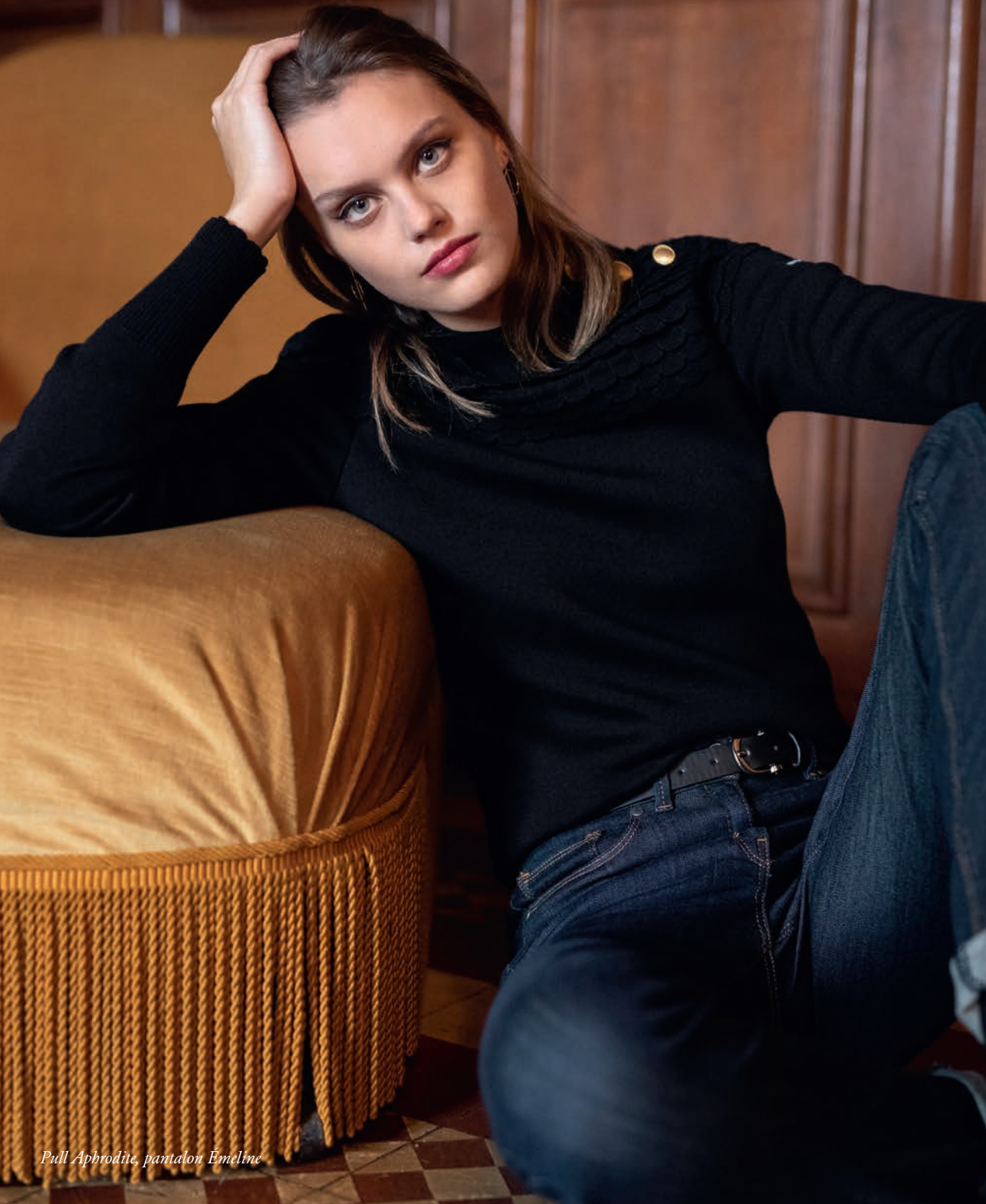
Pull Aphrodite, pantalon Émeline