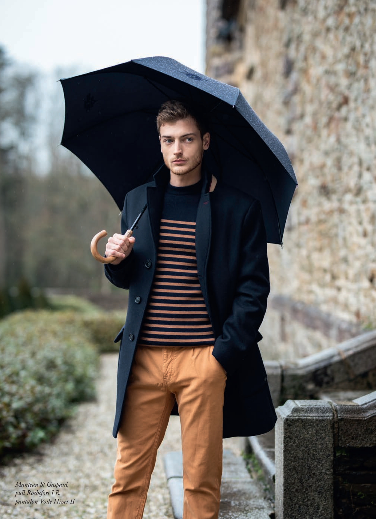
Manteau St Gaspard, pull Rochefort I R, pantalon Voile Hiver II