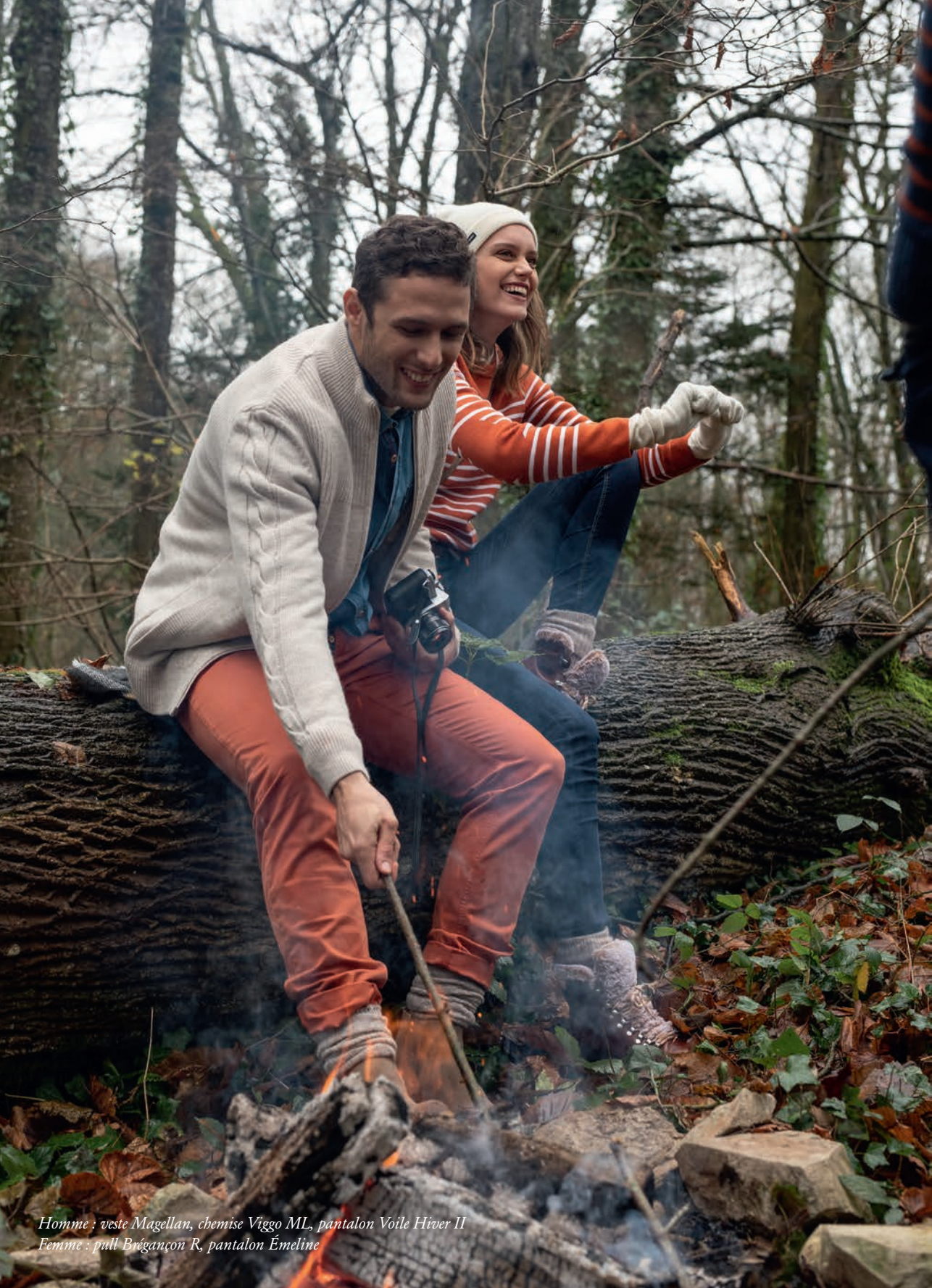
Homme : veste Magellan, chemise Viggo ML, pantalon Voile Hiver II Femme : pull Brégançon R, pantalon Émeline