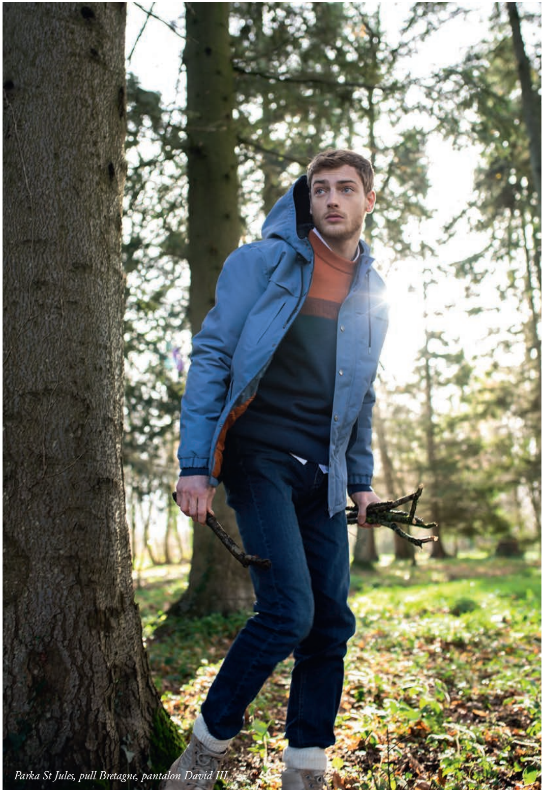
Parka St Jules, pull Bretagne, pantalon David III