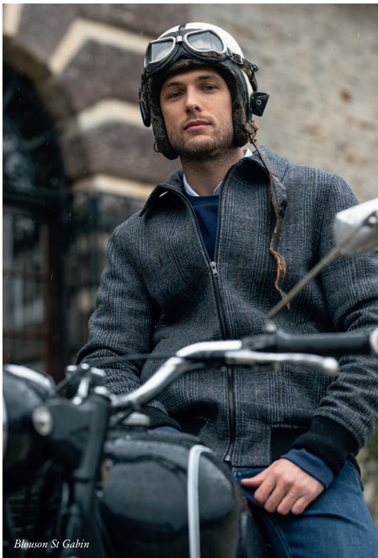
Blouson St Gabin

A new way of life, a new dress code, new references. The comfort of luxury woollen fabrics, coats, jackets and peacoats envelop you in a soft warmth in shades of natural beige and dark navy blue.