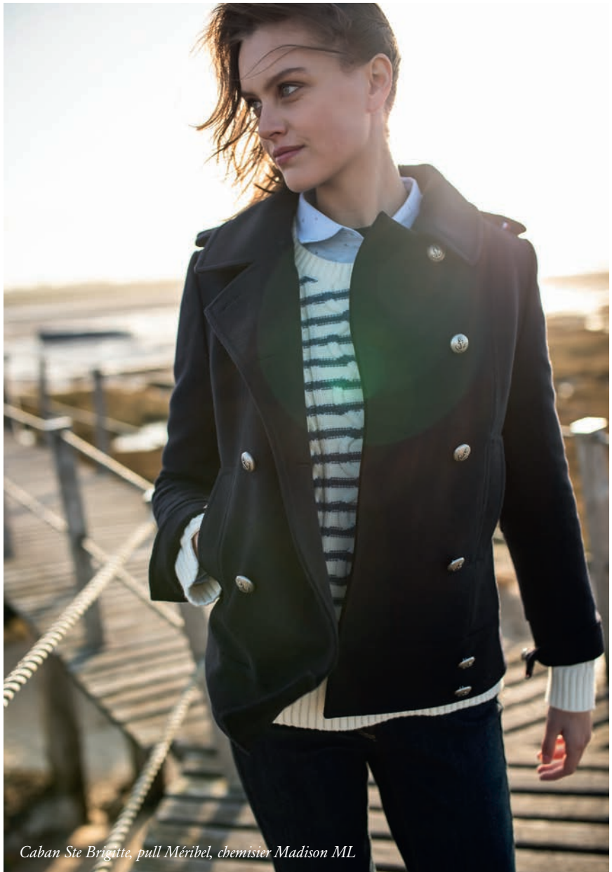
Caban Ste Brigitte, pull Méribel, chemisier Madison ML

P our une allure encore plus affirmée, on laisse dépasser les manches et le bas du tricot, que l'on découvre rayé et torsadé, porté sur un chemisier, doux et beau comme la lumière du jour.