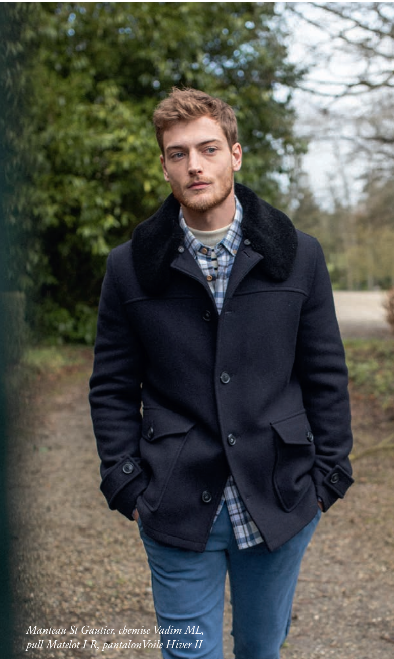
Manteau St Gautier, chemise Vadim ML, pull Matelot I R, pantalon Voile Hiver II

With daring fake fur on a classic wool cloth, shorter, more fitted cuts and ultra-trendy jackets, marine basics transcend the classical styles for a more urban look.