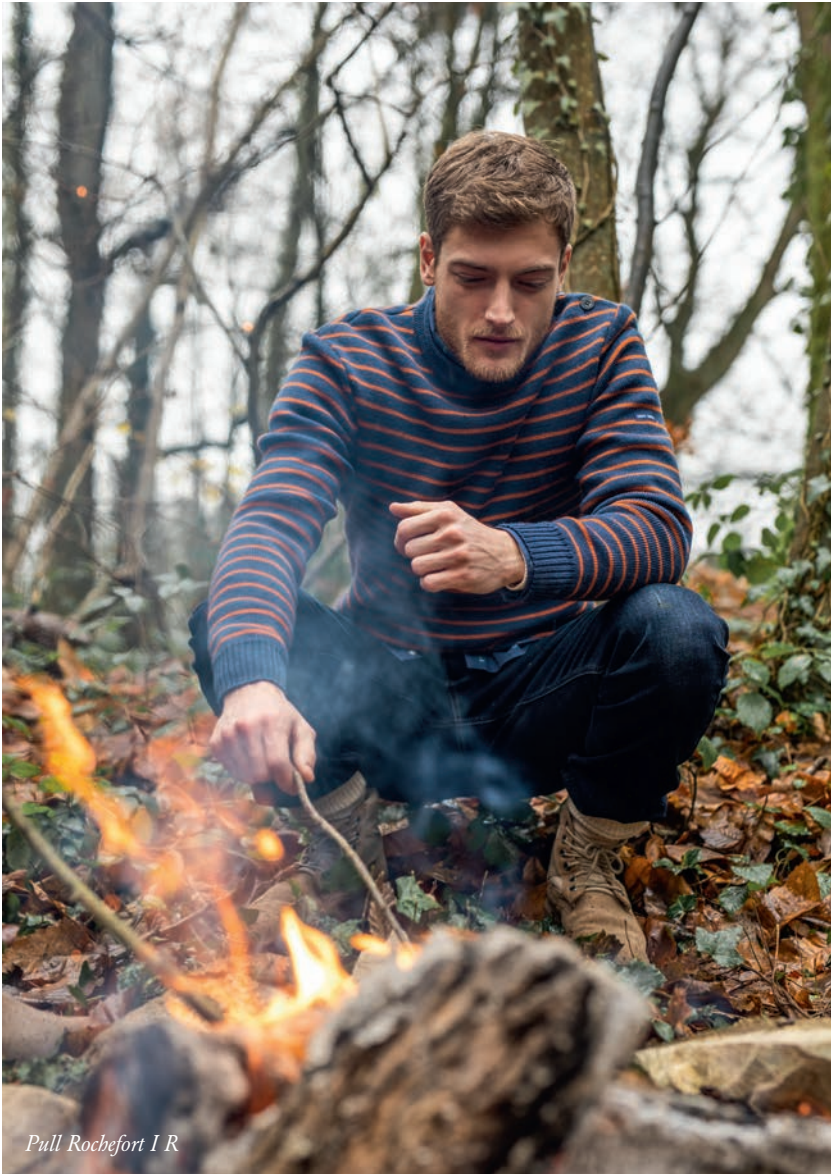
Pull Rochefort I R

M uni de gants, d'écharpes, de bonnets et de pulls aux inspirations nordiques, on improvise des bivouacs au bord d'un lac, on ramasse du bois dans la forêt, on respire à pleins poumons le parfum subtil de la nature.