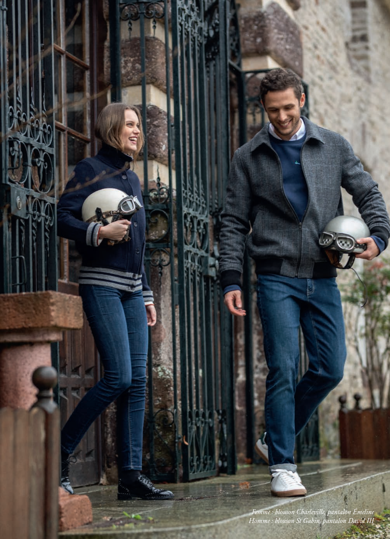
Femme : blouson Charleville, pantalon Émeline Homme : blouson St Gabin, pantalon David III